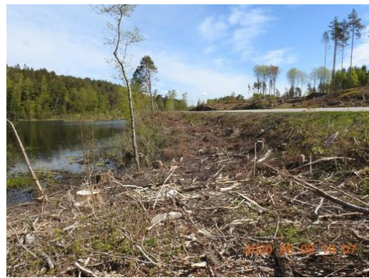
Politiets bilde fra befaring 8. mai 2020

Retten viser også til følgende oversiktsbilde etter hogsten, som viser det aktuelle området mellom Larkollveien og tjernet. Bildet viser også hvilke trær som ble stående igjen: