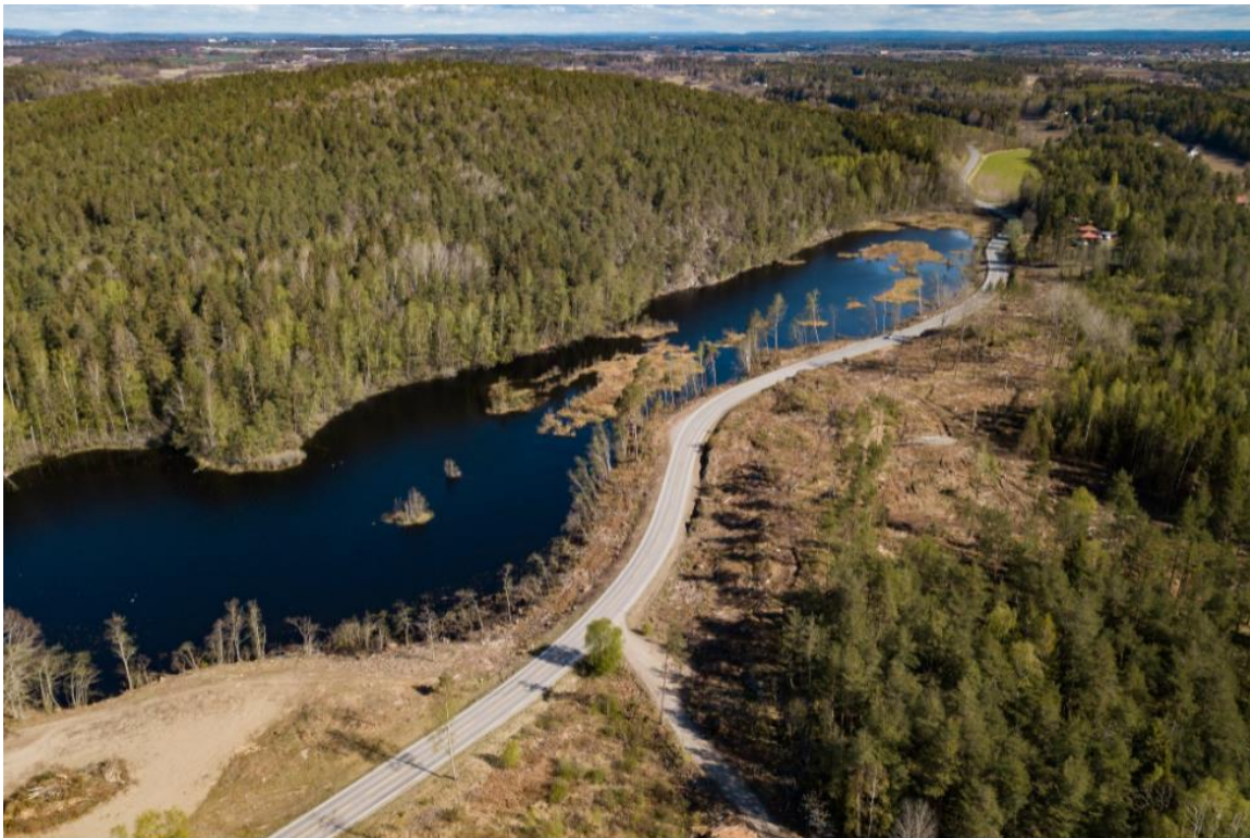
Oversiktsbilde publisert i avisen 30. april 2020.

Retten viser også til følgende oversiktsbilde etter hogsten, som viser det aktuelle området mellom Larkollveien og tjernet. Bildet viser også hvilke trær som ble stående igjen: