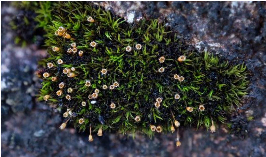
Bilde 3. En fin tue med Øygardsmose Glyphomitrium daviesii ved Burmavegen.