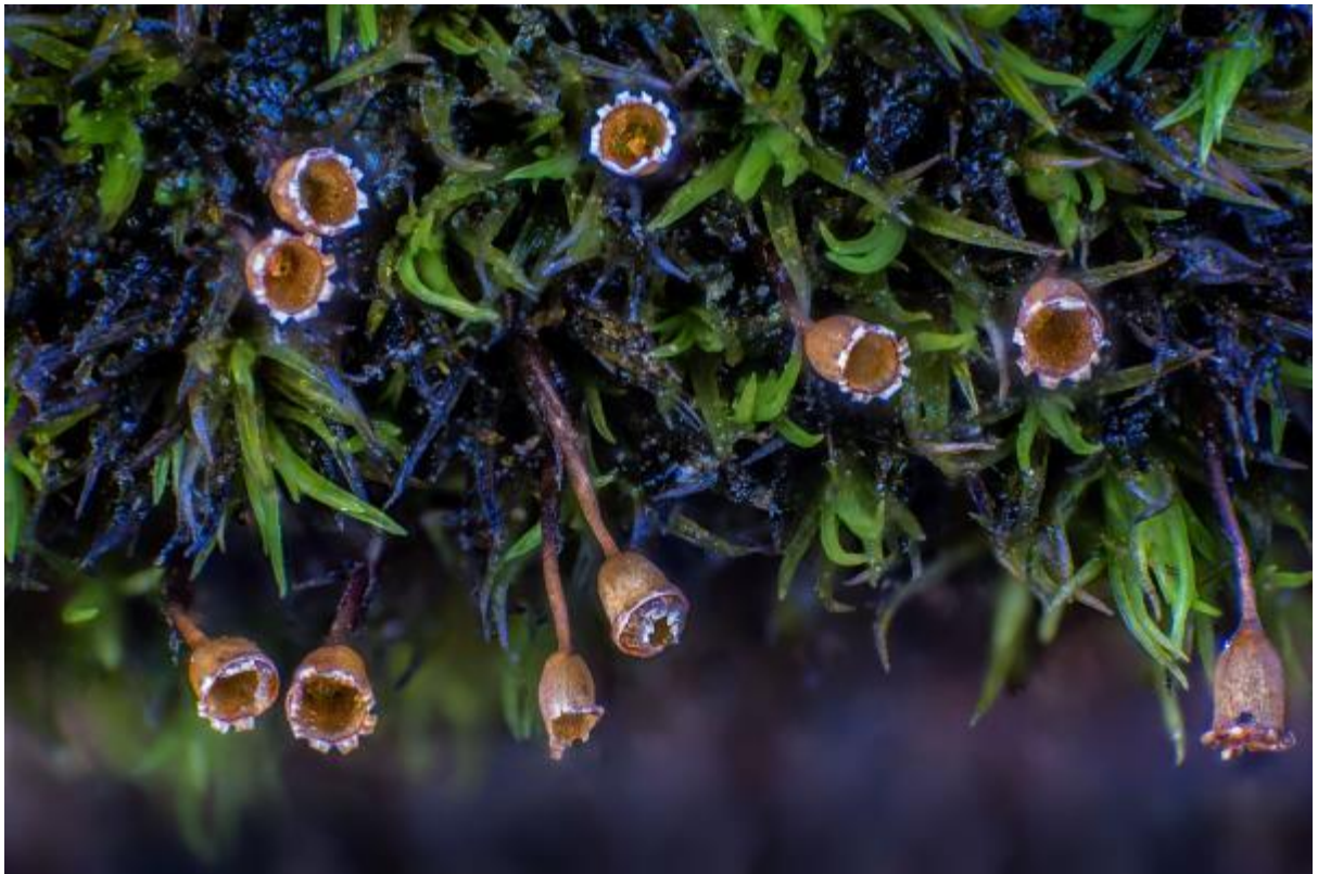
Øygardsmose Glyphomitrium daviesii funnet på Karmøy.