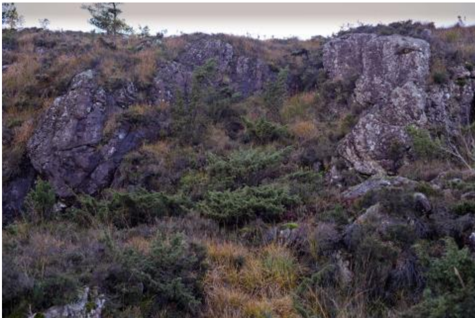
Bilde 4. Øygardsmose Glyphomitrium daviesii vokste øverst oppe på et nordvent berg.