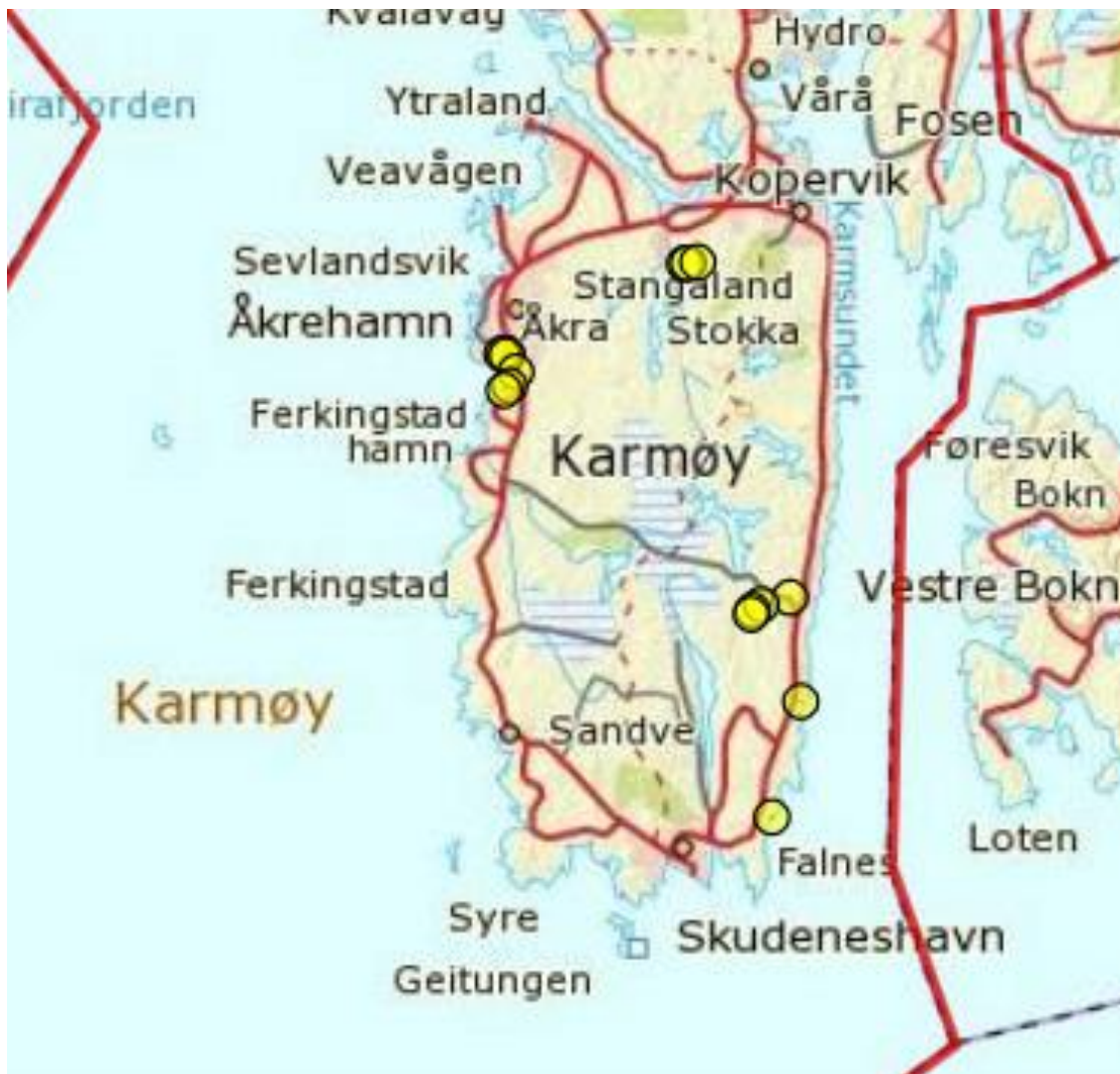
Figur 1. Kartet viser stedene som ble undersøkt.