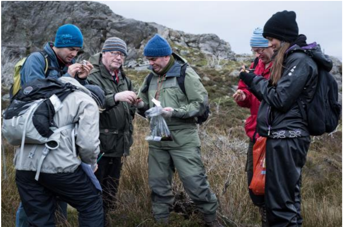
Bilde 2. Ivrige mosesamlere på Blikshavn.

endelige bestemmelsen tatt ved hjelp av stereolupe og mikroskop. Artene er lagt inn i Artsobservasjoner, og det sendes belegg av de mest spesielle artene til NTNU.