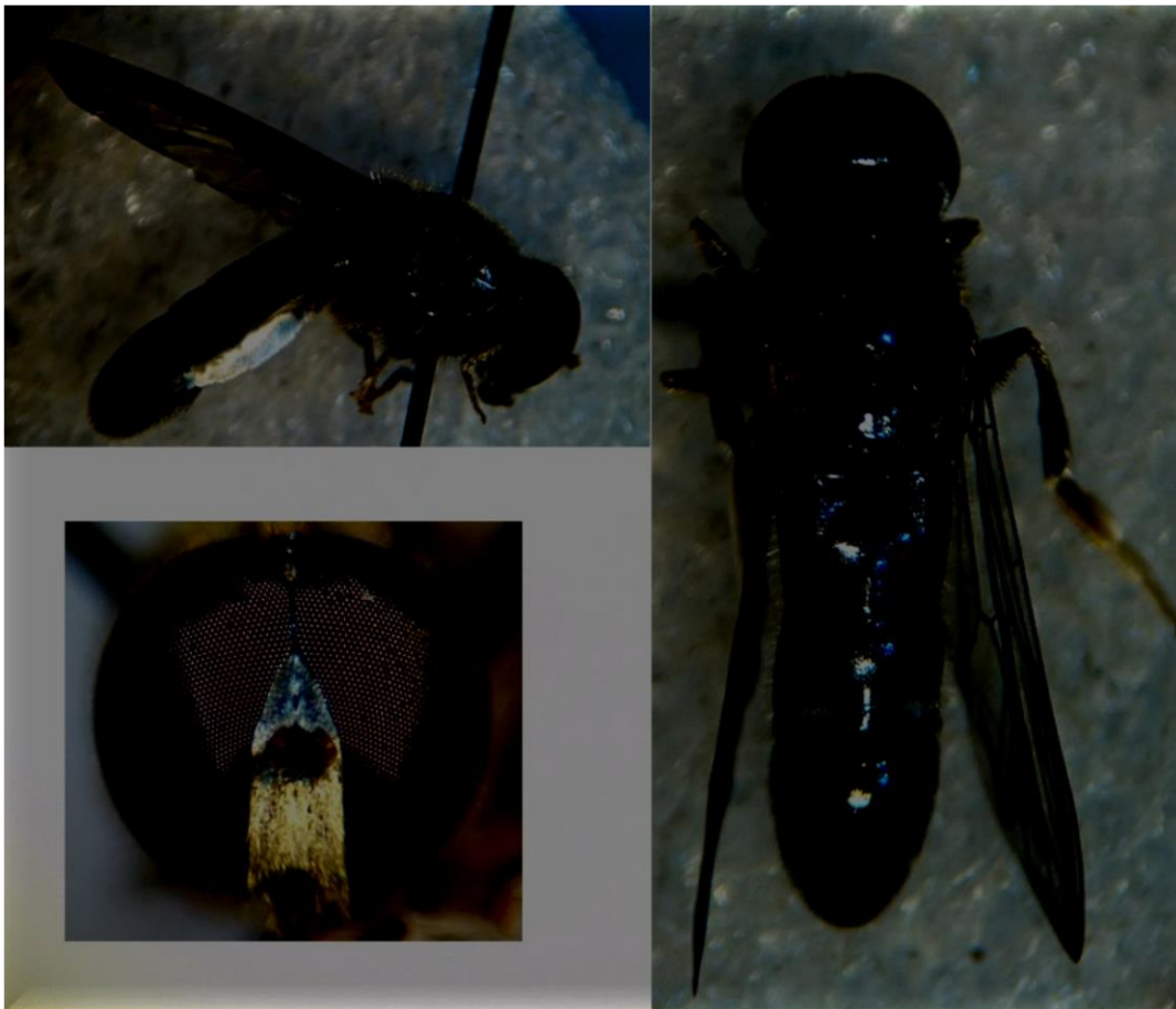
Sølvfotet måneflekkflue – Eumerus flavitarsis (VU). Fånefjell, Bygland 01.07.20. Andre funn i Agder ifølge Artskart.

En hann ble håvet i den rikt blomstrende veikanten i Fånefjell.