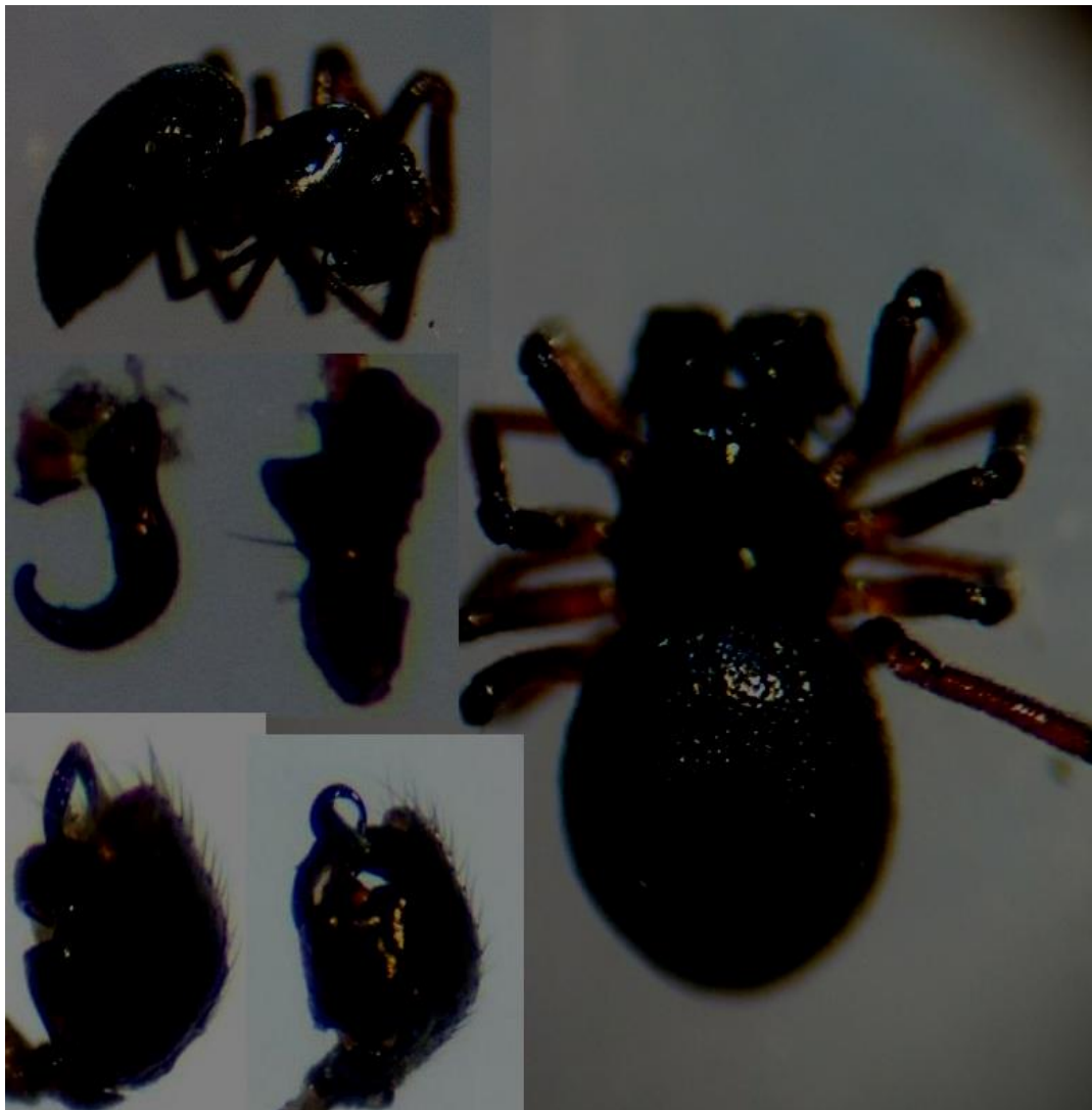
Hasselskjoldedderkopp – Ceratinella scabrosa. Fånefjell, Bygland 01.06.20. Dette er en sjelden edderkopp med kun 11 norske funn ifølge Artskart.

En hann ble funnet på natta langs grusveien som slynger seg oppover edelløvskogen i Fånefjell.