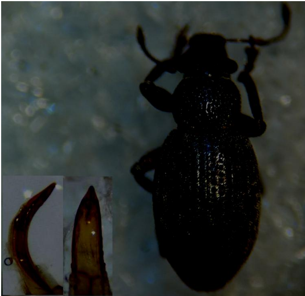
Strophosoma fulvicorne (EN). Hannåsfeltet, Evje og Hornnes 22.04.20.

Denne arten ble funnet på 3 lokaliteter i Evje og Hornnes kommune iløpet av våren og sommeren , og er nok langt mer vanlig enn hva rødlistestatusen tilsier.