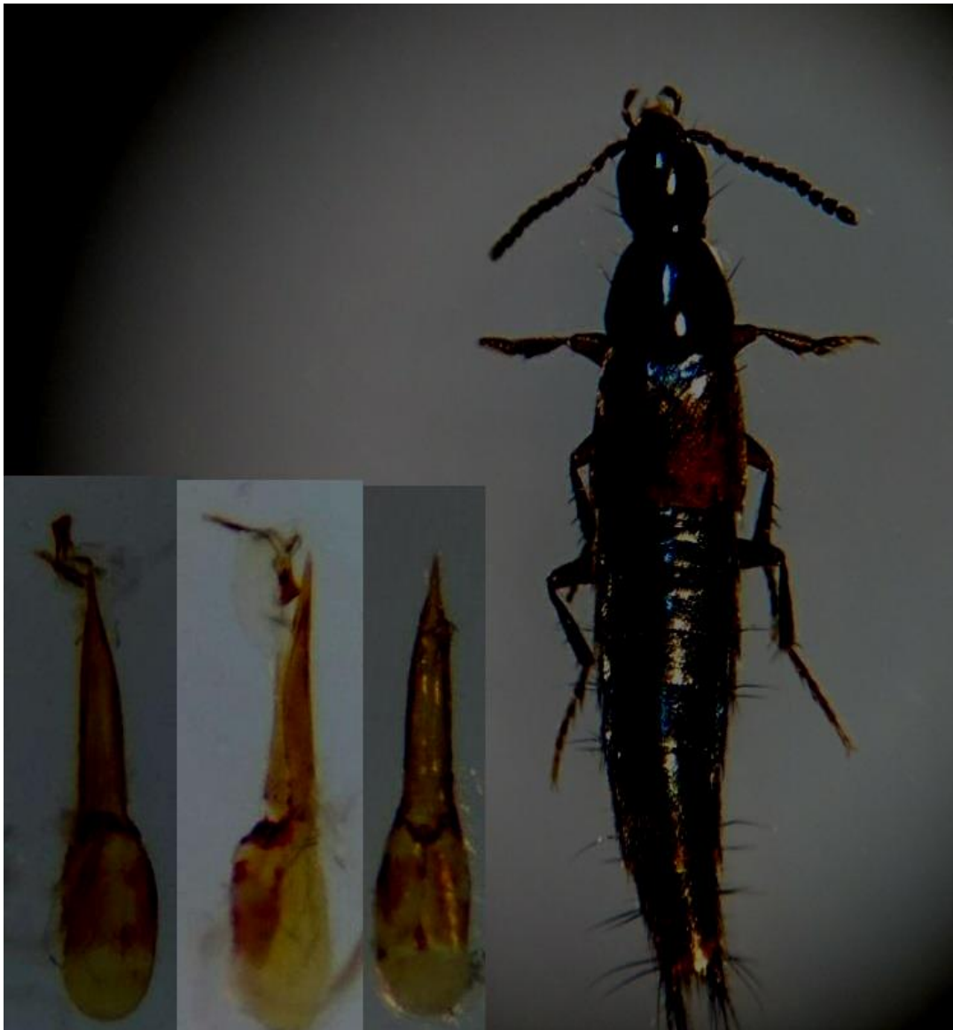
Heterothops stiglundbergi . Fjåbrumoen, Evje og Hornnes 24.04.20. Kun 6 funn i Norge ifølge Artskart og første funn i Agder.

En hann ble såddet fra gjødsel/kompost , trolig utkast fra et nærliggende gårdsbruk.